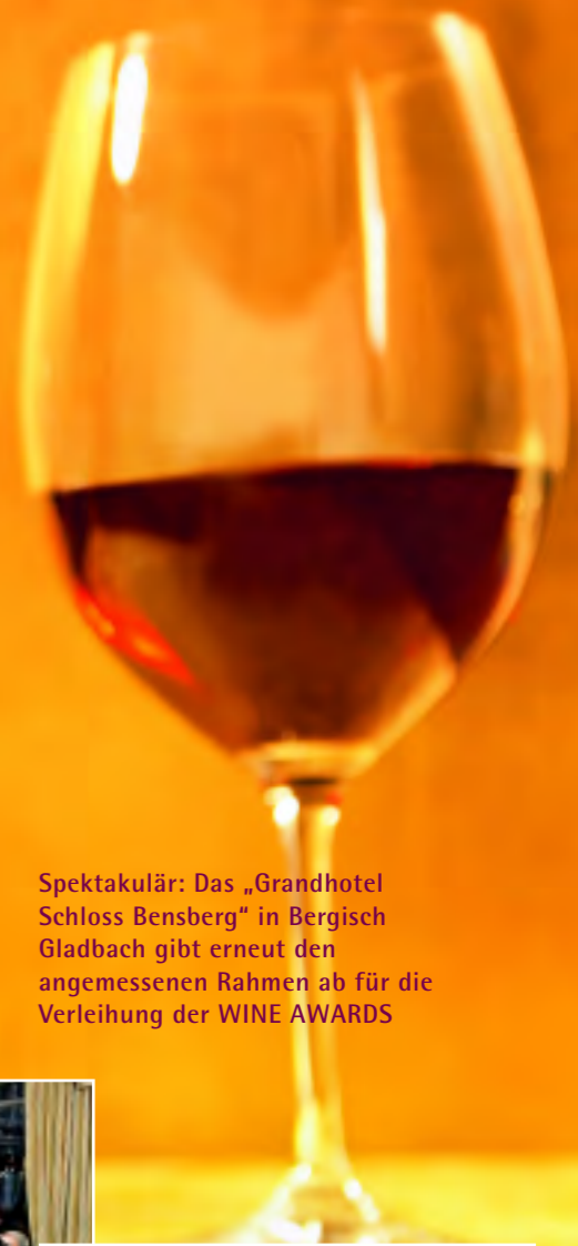
Spektakulär: Das „Grandhotel Schloss Bensberg“ in Bergisch Gladbach gibt erneut den angemessenen Rahmen ab für die Verleihung der WINE AWARDS

Diesmal verleiht die WEIN GOURMET-Jury die WINE AWARDS in sechs Kategorien. Ein deutscher Winzer erhält den Ehrenpreis für die „Weinkollektion des Jahres“. Anschließend werden internationale Spitzenwinzer als „Newcomer des Jahres“ und „Winzer des Jahres“ gewürdigt. Mit dem WINE AWARD für sein Lebenswerk ehrt WEIN GOURMET einen international renommierten Winzer, in der Kategorie „Legenden“ wird ein Wein mit Kultstatus ausgezeichnet. Und eine bekannte, sich zum Genuss bekennende Persönlichkeit des öffentlichen Lebens erhält schließlich die Auszeichnung „Weingourmet des Jahres“.